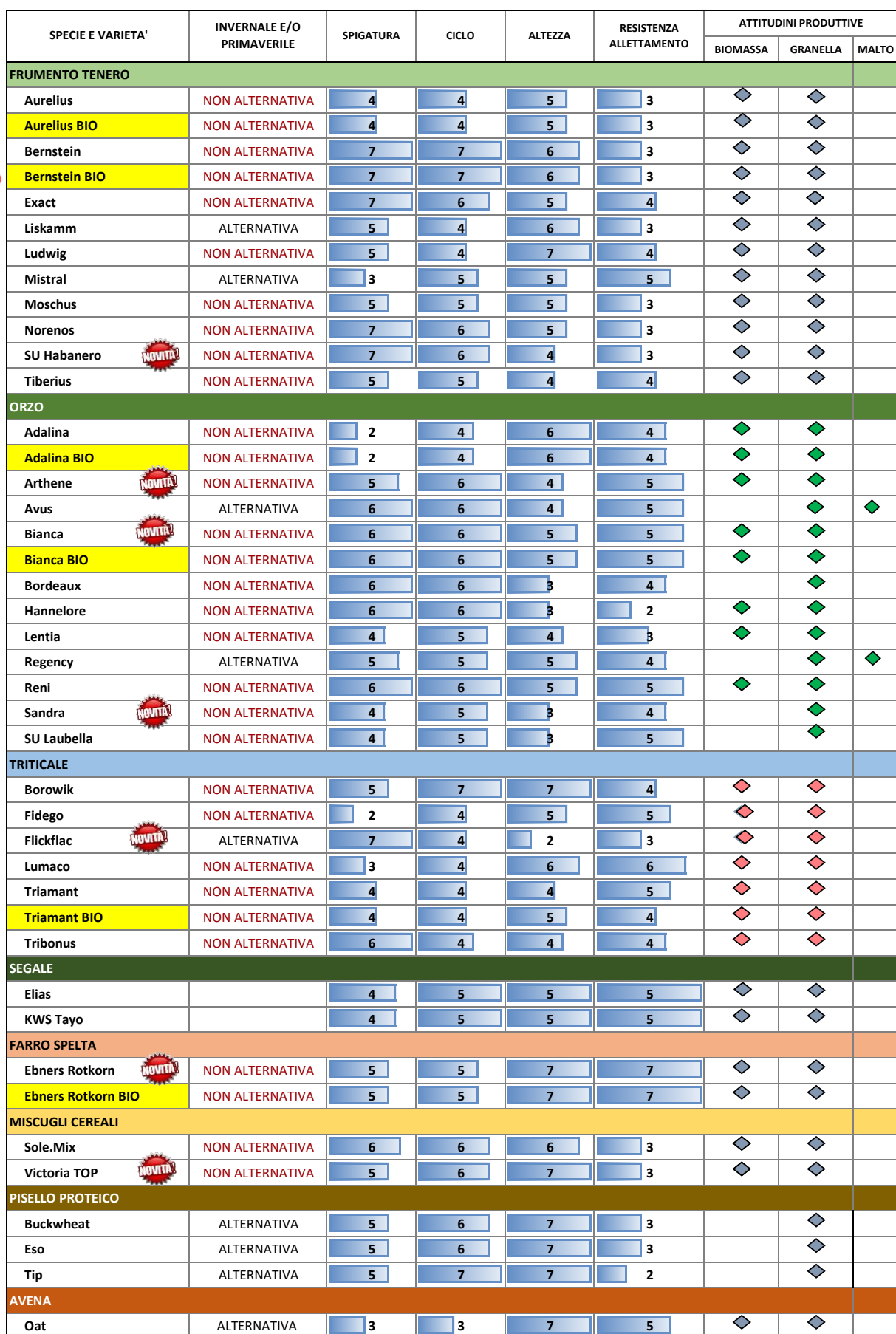
Tabella aggiornata varietà a catalogo 2024